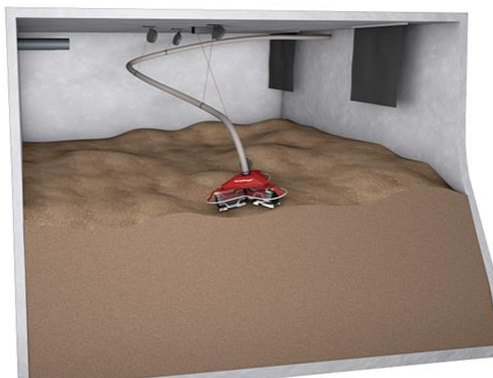
Abb. 1: Pellet Maulwurf E3 im gefüllten Lagerraum